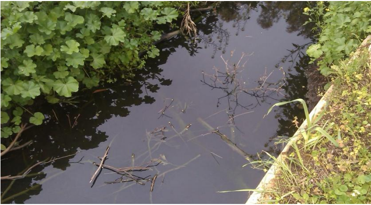
"مستنقعات الصرف الصحي"