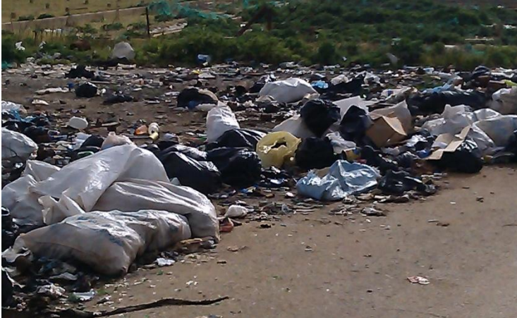
تكس القمامة بجانب الحي

يعاني السكان من عدم وجود سيارات لنقل القمامة فيقوم السكان بوضع القمامة بجانب الحي السكني وسبب ذلك تلوث في الهواء الجوي.