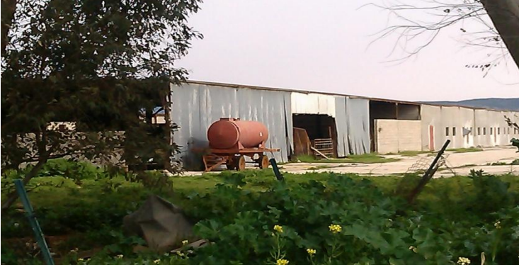
"استطبلات الابقار والدواجن"

عن وجود بجانب الحي "اسطبلات" لتربية الابقار و الاغنام والدواجن الأمر الذي أدى إلي انتشار الغبار والروائح الكريهة بالإضافة إلي تسببها في تلوث ملحوظ في المكان.